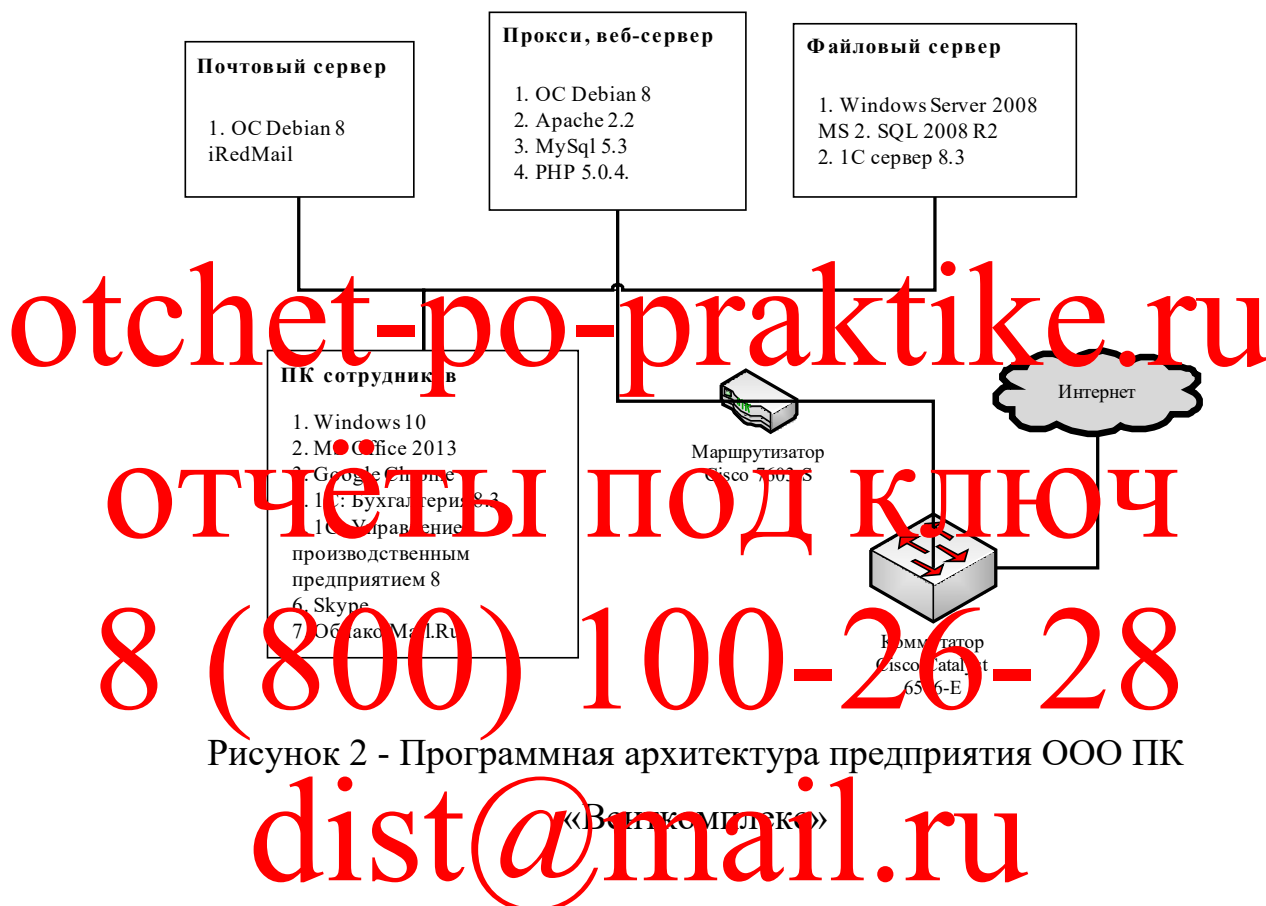
Рисунок 2 - Программная архитектура предприятия ООО ПК

Программная архитектура предприятия ООО ПК «Венткомплекс» представлена на рисунке 2.